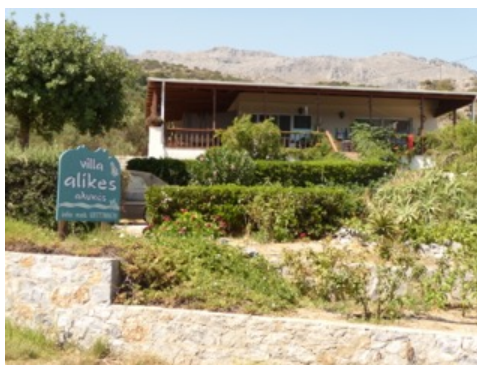
die Villa Alykes – ein Haus weiter ist das Haus von Stelios/ unser „Tango Zentrum“