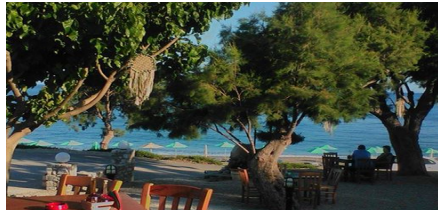
La Milonga Kreta